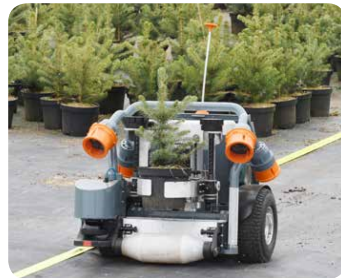
Utrustning för GPS-styrning av traktorer i plantskolor